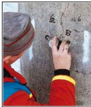
Her måles bredden på sprekke i en av pilarene på Elgeseter bru.

Den mest utbredte er mylonitt, som finnes i geologiske «skyvesoner» og forkastningssoner. Andre er omdannet sandstein, gråvakke, leirskifer og rhyolitt.