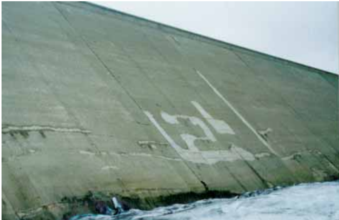
Foto 1 Reparasjoner i damplater sett fra vannsiden