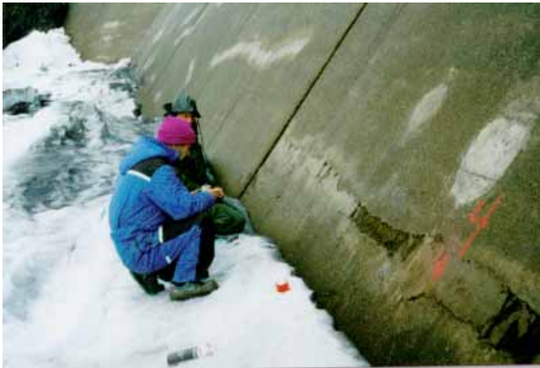
Foto 2 Reparasjon utført for hånd og skadet.