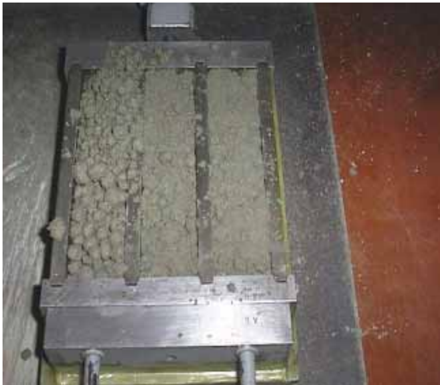
Foto 5 Reparasjonsmørtel med pellets