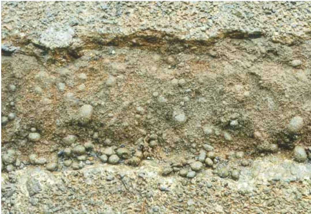
Foto 3 Detalj av reparasjon utført for hånd med pellets og smuldrende konsistens