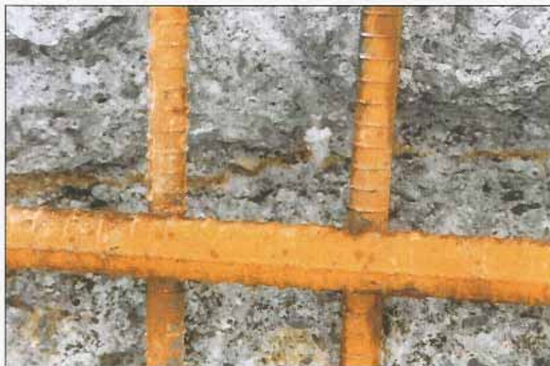
FIGUR 4 Detalj av opphugget og spylt betong. Merket sprekken under armeringen (brunfarget).