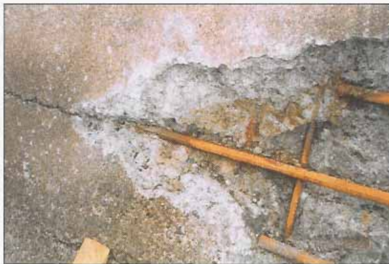
FIGUR 3 Opphugget betong. Merket at det kun finnes begynnelsen av overflaterust på armeringen.