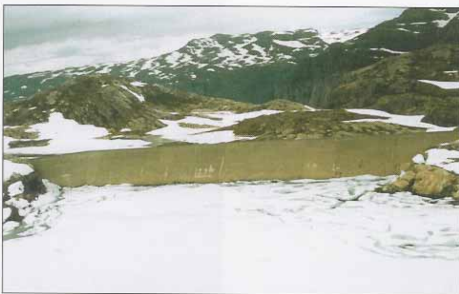
FIGUR 1 Dam Langevann, dam 1, fotografert fra helikopter sommeren 2000. Merk feltene med reparasjoner som ble utført i 1997.

Dam Langevann er eid av A/S Tyssefaldene og ligger sørøst for Tyssedal ved Sørfjorden. Dammen var en gang Norges største platedam (31 m høy og 300