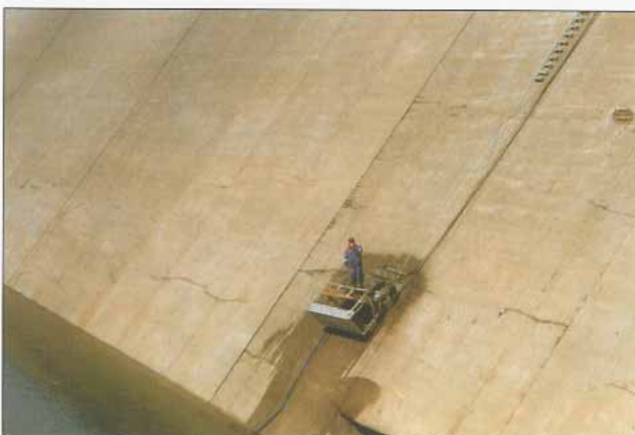
FIGUR 2 Opphugging av betongen sommeren 1996. Merk de horisontale sprekker og frilagt armering flere steder.

Ifølge notatene fra byggekontrollen, skal det ha vært store problemer med å pumpe betongen. Ved stopp i pumpen gikk