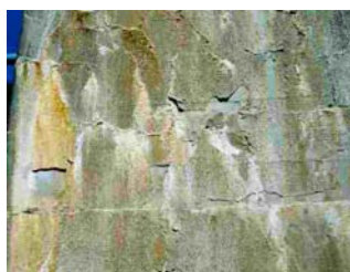
Avfasett overflatebehandling på dam

NBTL er en kunnskapsbedrift og har som intensjon å være nyskapende innenfor betong og tilslag samt forvaltning, drift og vedlikehold av betongkonstruksjoner (FDV). NBTL vil derfor initiere og ønsker å delta i norske og internasjonale forskningsprosjekter og ringforsøk.