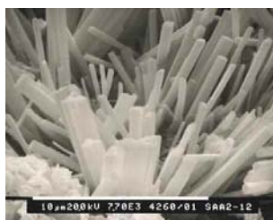
Reaksjonsprodukter sett i elektronmikroskop