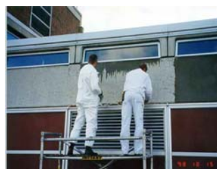
Forskningsforsøk med silan-impregnering